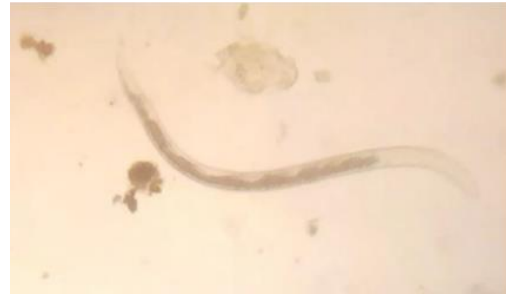
الشكل 4 يرقة الجنس Muellerius X 200