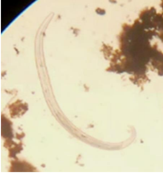
الشكل 6 يرقة الجنس Cystocaulus X 200