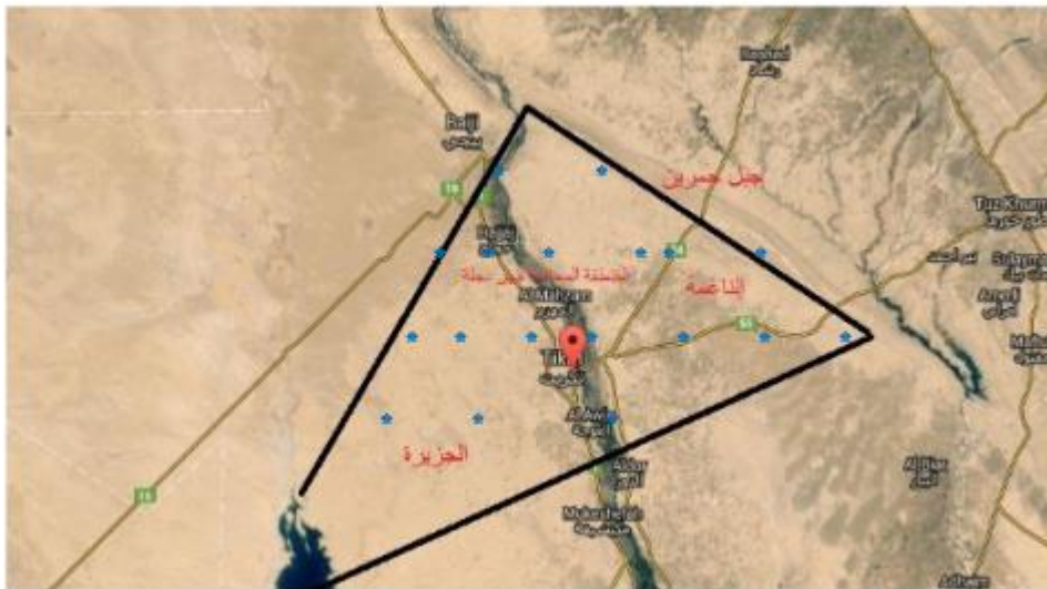
الشكل (2) خريطة تكريت موزع عليها مناطق البحث