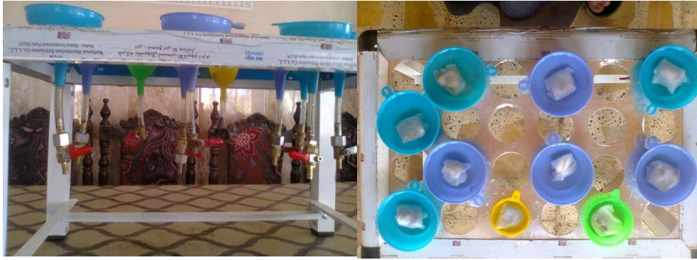
الشكل 1 اجهزة بيرمان المحورة

وكما موضحة في الشكل 2 , ويعتبر قضاء تكريت مركز محافظة صلاح الدين ومن الاقضية الرئيسية للمحافظة ويقع مركز القضاء على الضفة اليسرى لنهر دجلة عند خط عرض 34° 65' وخط طول 43° 63', لقد تم جمع العينات من مناطق البحث اعلاه بين خط العرض 34° 36' الى 34° 50' وبين خطي الطول 43° 10' الى 43° 05' 44', وإن عدد العينات التي فحصت من براز الأغنام هي 1298 عينة منها 734 عينة من الضأن و564 عينة من المعز , وكان عدد العينات المفحوصة من المنطقة الأولى 444 عينة برز منها 355 عينة ضأن و192 عينة معز , اما المنطقة الثانية الواقعة شرق وغرب نهر دجلة وبمعدل عرض 6 كم فكانت عدد العينات المأخوذة منها 432 عينة منها 244 عينة ضأن و188 عينة معز اما المنطقة الثالثة فقد فحصت منها 422 عينة منها 238 عينة ضأن و184 عينة معز .