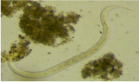
الشكل 7 يرقة الجنس Neostongylus X200