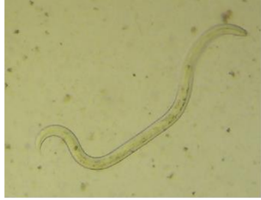
الشكل 3 يرقة الجنس Dictyocaulus X 200